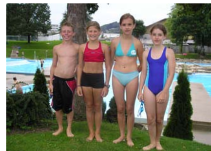
Siegerstaffel der Klasse P.Stengel