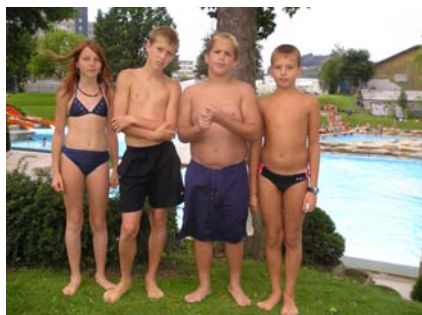
Siegerstaffel der Klasse P.Falk

An dieser Stelle gebührt Frau Gerda Högger ein herzliches Dankeschön für die tadellose Organisation des Wettschwimmens.