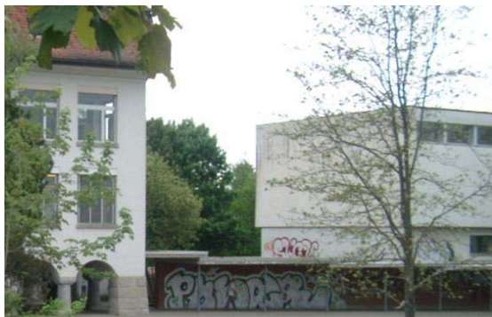
Vor der Renovation

An dieser Stelle danken wir dem Gemeinderat und dem Schulrat ganz herzlich für die Investition, die unsere ganze Schulanlage in ihrem Erscheinungsbild aufwertet.