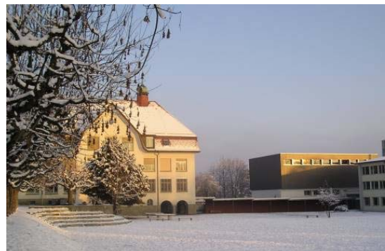
Nach der Renovation