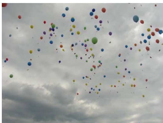
Wie ein Vogelschwarm flogen die Ballons in die Höhe.