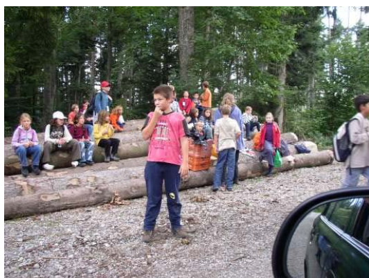
Zum Mittagessen gab es im Wald ein feines Schnitzelbrot

Einige Ballone landeten im Sa-fiental, ein paar andere überquerten sogar das Gebirge und flogen bis zum Comersee.